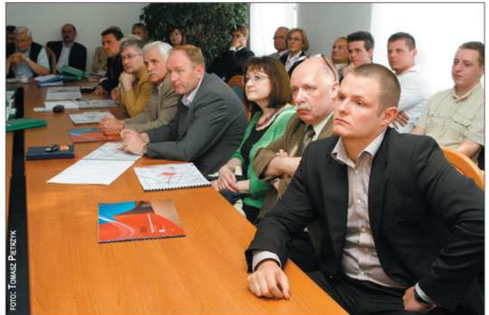
W miniony wtorek spora grupa świdnickich radnych zapoznana się z planami dwóch inwestorów, którzy chcieliby w Świdnicy wybudować galerie handlowo-rozrywkowe. Od radnych zależy decyzja, czy obiekty powstaną, a także – jak szybko to się stanie